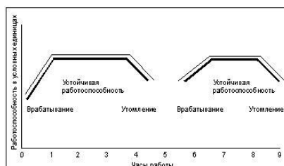
Рис. 1. Фазы рабочего периода 1

На все иллюстрации (рисунки, диаграммы) в тексте должны быть даны ссылки. Рисунки должны располагаться непосредственно после текста, в котором они упоминаются впервые, или на следующей странице. Рисунки и диаграммы нумеруются арабскими цифрами, при этом нумерация сквозная. Подпись к иллюстрациям располагается под ними посередине строки. Подпись должна выглядеть так: